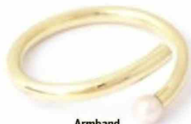
Armband Elisa Lee adviesprijs: 1400 euro elisa-lee.be