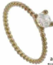
Ring Supermom adviesprijs: 325 euro supermomantwerp.com